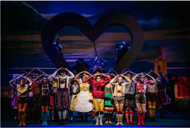
IM WEISSEN RÖSSL – Theater Trier