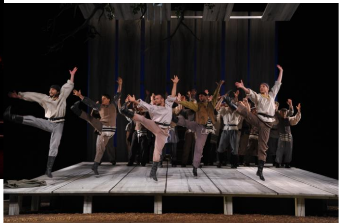
ANATEVKA – Pfalztheater Kaiserslautern