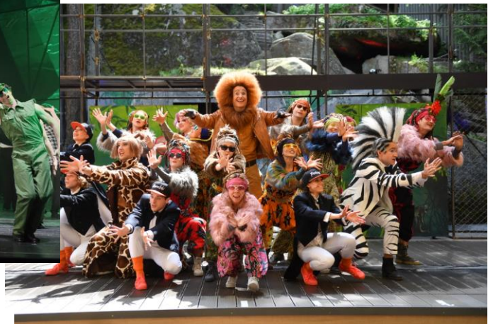
MADAGASCAR – Luisenburgerfestspiele Wunsiedel