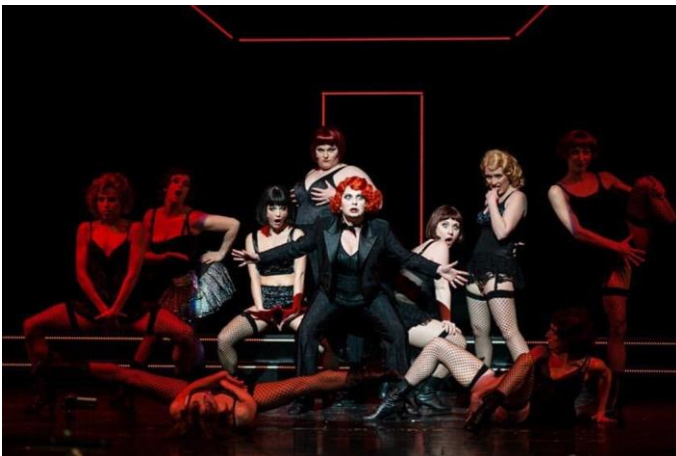
CABARET – Pfalztheater Kaiserslautern