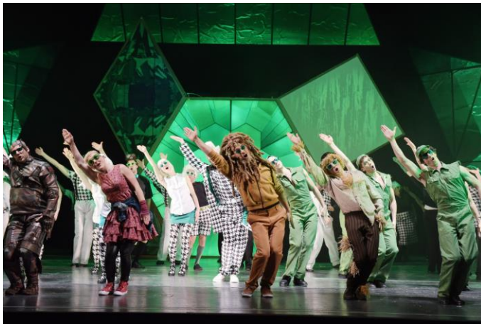
DER ZAUBERER VON OZ – Theater Magdeburg